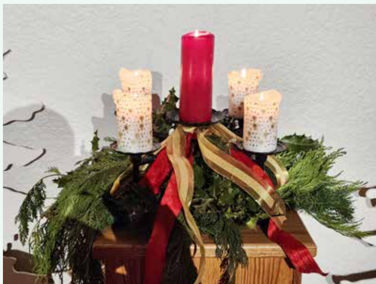
Christmas Eve Candlelight Service