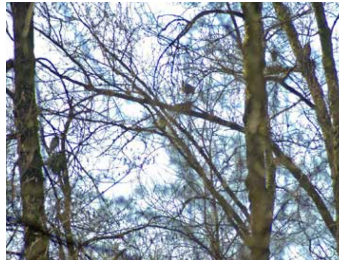
林の中のオオアオサギの巣場、この写真の中に4個の巣がある