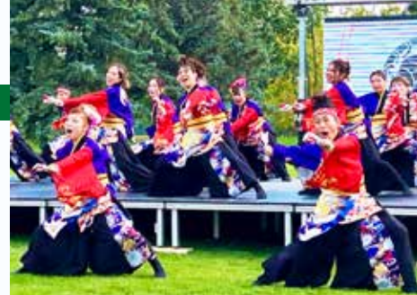
夜奏華チーム(カルガリー)のステージ