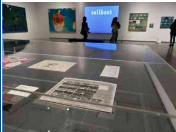
Art Gallery of Ontario