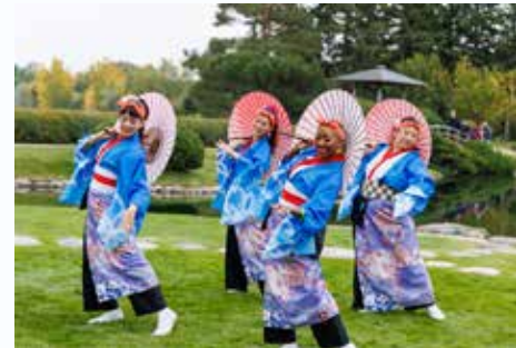
園内の橋の前で踊る桜舞チーム(トロント)