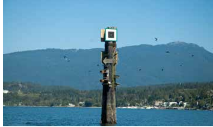
ポートムーディー、ロッキーポイントの沖の杭に建つムラサキツバメの巣箱

集団で巣を造る鳥として当地で良く知られるのが、ミズナギドリ、ツバメ、ミドリツバメ、ムラサキツバメ、イワツバメ、オオアオサギ、更に少し緩い群れとしてはカナダガン、カナダヅルなどがあり、群れの強さを利用して子育てをする。ホシムクドリに話を戻すと、彼らの巣場は普通約1キロ四方に分散して別集団の巣と入り混じって造られるが、餌場はその小集団毎に別に決まっていて、その餌場に集まることで仲間との連携を強めていることがわかってきた。人間にも似た習性があり、例えば「〇〇県人会」「XX大学同窓会」といった集まりで外敵とは関係無いが、その集まりでは、育った場所や学んだ場所が共通しているところから人の交友を深めやすいのと似ている。更に意外な発見は、10年前にホシムクドリは隣同士では巣を造らないと言われていたのに、最近の研究用に作られた、3メートル間隔で杭に取り付けられた人口の巣箱には、他集団のホシムクドリ達が混在して早い者勝ちにその巣箱を使うことだった。「折角、丁度良い巣箱が出来ているのに使わなければ損だ」と学習したからではないかと僕なら思う。理由はどうであれ、彼らは我々が考える以上に生きる術を知っているからではないだろうか。それがヨーロッパに何百万年間生息してきたホシムクドリが、100年余りの間に此処までの集団で新天地、北アメリカの大地に適合出来たかを解く鍵で、生き方を変えても、団体としての繁栄を望んで来た人間との共通点があるような気がする。