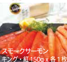
スモークサーモン キング・紅 150g x 各 1 枚