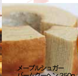
メープルシュガー バームクーヘン 250g