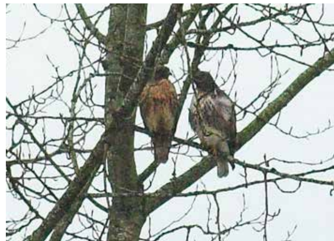
当地で最も多い鷹、アカオノスリの番いは独立した巣を造る