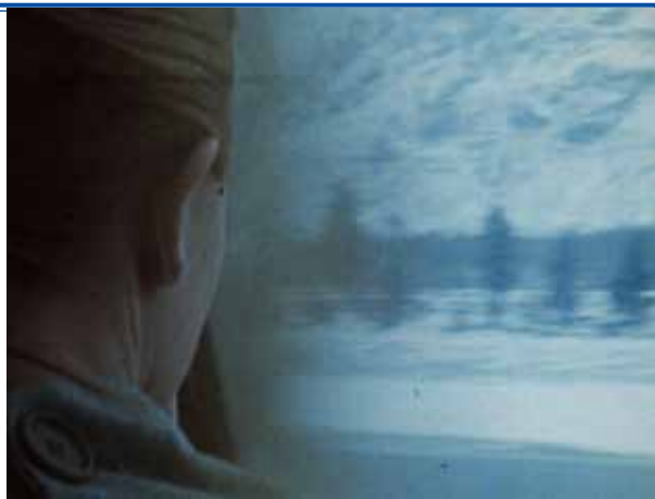
『Reason Over Passion』

『Sailboat』は同じ動作の短い繰り返しで作られている。画面の左から右へとボートが流れていく。それだけだ。しかし繰り返しとはいえ、そのうち観客の想像していたものとは違ったものが映る。あれっと思う声が出る、肩透かし感が面白い作品だ。この作品の面白さを紐解いてくれる理論もちゃんとある。クリスチャン・メッツの言う、私たち観客は常に画面に映っていない場所にいることしかできないため、カメラが私たちの目になるという考えだ。私たちは機械的に映像を見せられることで映画と一体になれる。それはどんな作品でも変わらない。だからこそカ