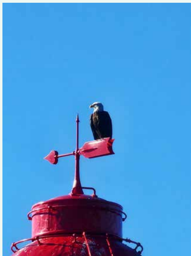
灯台守り。Light House Park にて。