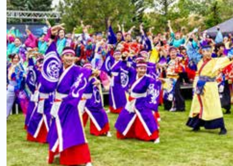
全員で『奏楓-KAEDE-J』を舞い踊った