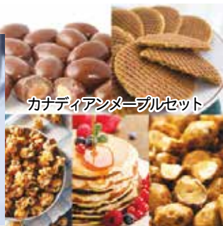
カナディアンメープルセット