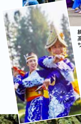
帯屋町筋(お びやまちすじ) チームの踊り