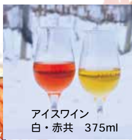
アイスワイン 白・赤共 375ml