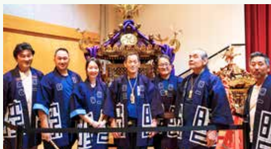
楽一20周年祝賀会で新しい半纏をまとって