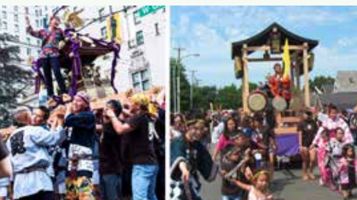
2013年のバンクーバー・カナダ・デー・パレード(写真左)、2013年のサーモンフェスティバル(右)