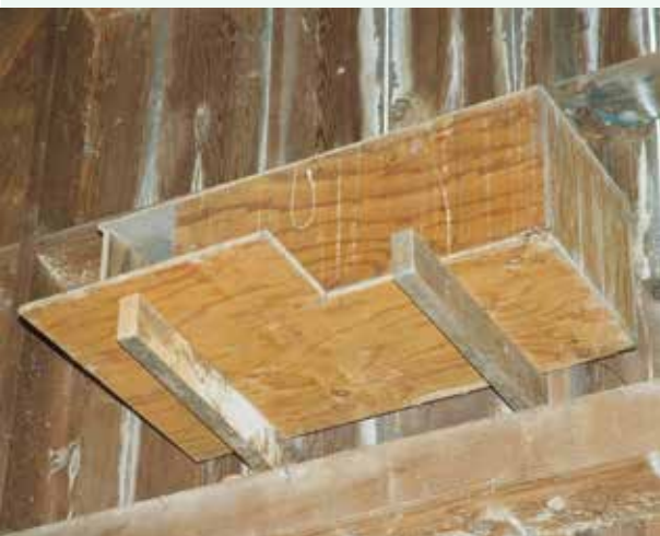
メンフクロウの巣箱

更に翌日、この街のミネカダ公園に12年ほど前に取り付けた巣箱を見に出かけた。ここでは毎年ひと番いが春になるとここに来て巣を作る。この公園管理者も、この日も協力して梯子をかけてくれた。そこにはもっと大型の、ベランダまで付いた巣箱があり、妻が梯子を抑え、僕一人で重い箱を取り付けるのに苦労した思い出がある。いつものとおり、先ず巣箱の上の天井を見ると、そこに渡されたパイプの上に見慣れた顔が、いかにも『やあ、久しぶり』と言った顔でこちらを見ていた。