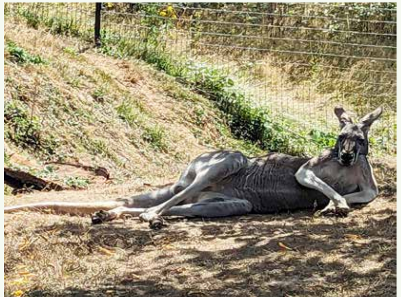
Vancouver Zooのスーパーモデル?