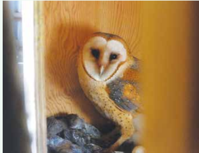
コロニーファームの巣箱の中のメンフクロウ

話が合った。翌朝、出掛けて建物の外壁に6インチ四方の穴を開け、内側の木組みに取り付けた箱の後ろにも観察用の扉を付けて置いた箱の裏側に梯子を掛けてそっと3センチくらいその扉を開けると、居た。メスのメンフクロウが物音に気付いて、こちらをじっと見ていた。瞬時に右手に持っていたカメラで1枚、驚かさないようにフラッシュを使わずにシャッターを押し、すぐに扉を閉じた。その間5秒。その驚きも恐れもないつづらな眼は、しっかりと僕の心に焼きついた。