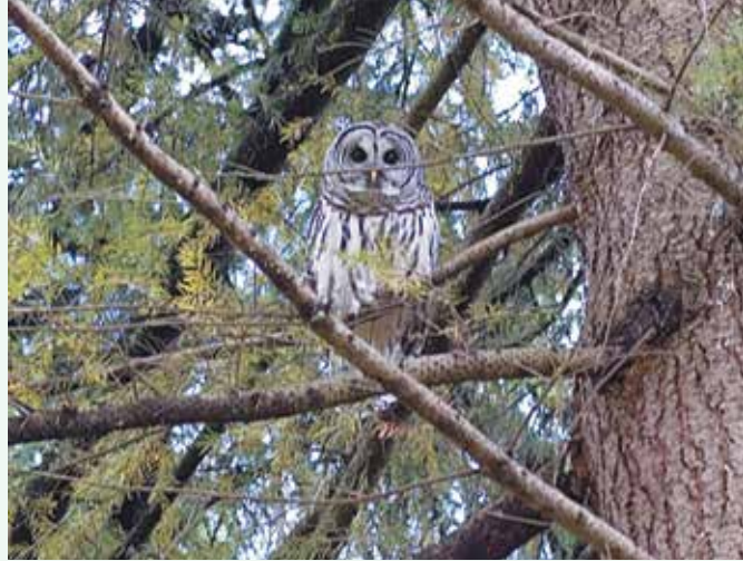
アメリカフクロウ

今までにフクロウの巣箱を10個前後作ってこの地域の数か所に取り付けた。巣箱を使う種としてBarred Owl、Screech Owl、Pigmy Owl、Barn Owlが知られている。なかでもBarn Owlはその名の通り家畜小屋や空き家の内側の壁にある梁の構造などを選んで巣を作るが、箱があればそれを優先する。箱にはフクロウの種類によって多くのデザインがあるが普通スーパーに置かれた買い物籠くらいの大きさの箱を合板で作る。入り口、観察口、掃除しやすさ等から幾つかの工夫が凝らされ、今でも作るたびに改良をしている。コキットラムのコロニーファーム公園の近くでは、数年前まですぐ近くのハイウェイの橋の下に巣を作っていたが、やがて姿を消してしまった。そこで再誘致をしようと公園内の建物に、管理者が協力してくれ、箱を取り付けたのは3年前。その2、3日後からこの辺りの鳩が早速その箱を見つけて巣を作って住み着いた。『誰も使わないよりいいや、』というわけで放って置いたが、管理の人が見かねて建物の反対側に別の穴を開け、屋根裏を鳩に開放してくれた。その効果があったらしく、4月半ばにその人から、一羽のメンフクロウが鳩を追い出して巣箱に入った、と電