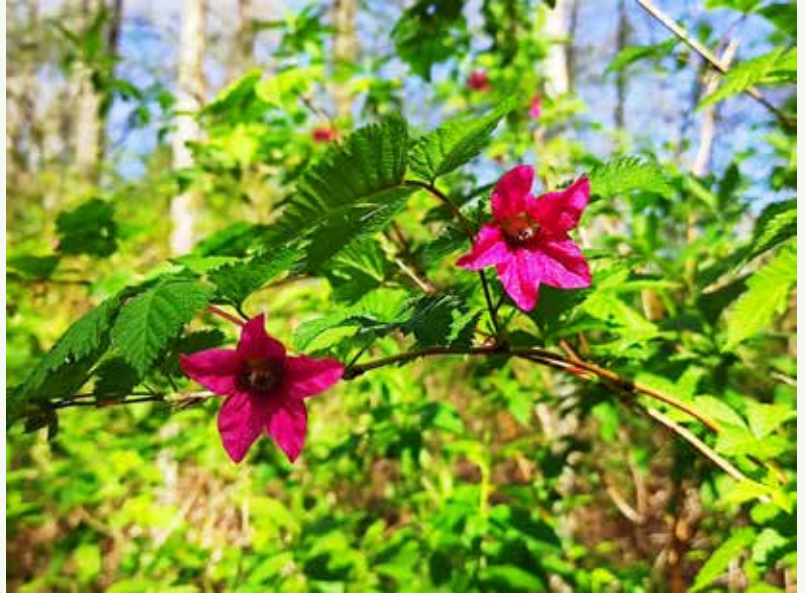
South Arm Marshesで見たSalmonberryの花