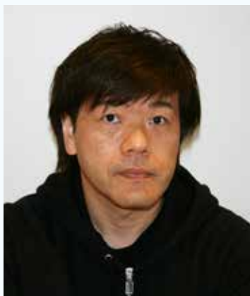
小説家 平野 啓一郎(ひらの・けいちろう)さん