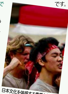
日本文化を体感する貴重な機会だ