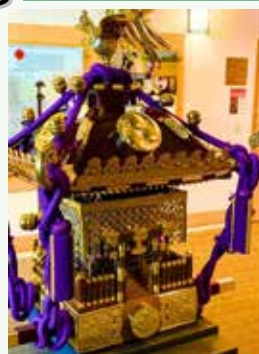
神輿楽一製作の神輿(左)、パレード中お囃子隊を乗せた山車(右)

はい、本体の木組みから作りしました。おそらくゼロから作った神輿は北米で初めてのものだと思います。