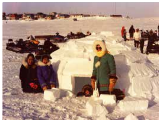
1982年春のケベック州ボヴァンゴニック。イグルーの右側の立膝姿が筆者

零下10度の中、氷の上に TENT を張ってキャンプ用ストーブを燃やし、お茶(紅茶)を沸かし始めた。イヌイットにとって「ストーブ・タバコ・お茶」の3つはキャンプに欠かすことのできないものである。凍った手をストーブで温め、お茶を飲みながら、3人の男たちは代わる代わる作業に当たっている。私は内心「まだ出発して間もないことだし、こんなに修理に手