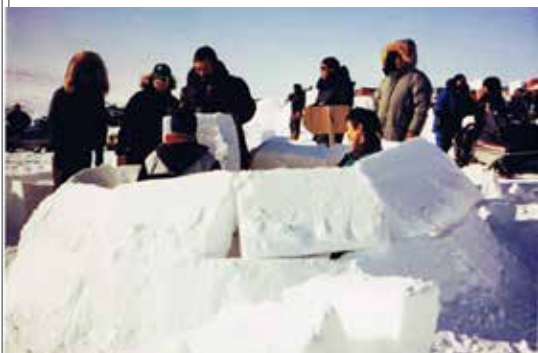
イグルー造りコンテスト

イグルー造りコンテストに集まった男たちは二人一組のチームを作り、どのチームが一番早くて頑丈なイグルーを造り上げることが出来るかを競い合う。まず第一に、イグルー造りに最高の硬くしまった雪を選び、スノーナイフでブロック状に切り出す。それをらせん状に天井まで組み上げたら、最後に入り口を開けて完成となる。