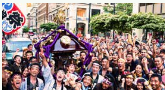
バンクーバー・カナダ・デー・パレードを大いに盛り上げた(2013年)