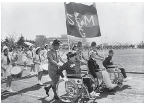
東京パラリンピック 愛と栄光の祭典