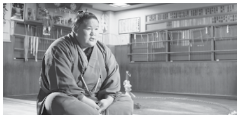
相撲道〜サムライを継ぐ者たち