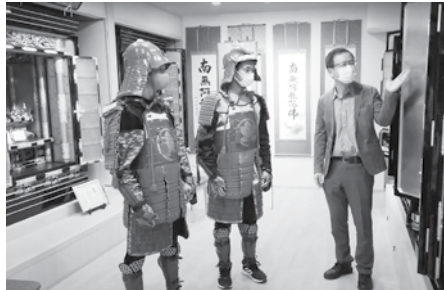
地場産業の仏壇作りの話を聞き出す甲冑姿の二人。

本イベントはオンラインのズーム上だけでなく、ユーチューブライブの形でも同時配信がな