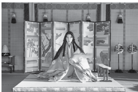
十二単衣を着た悪魔