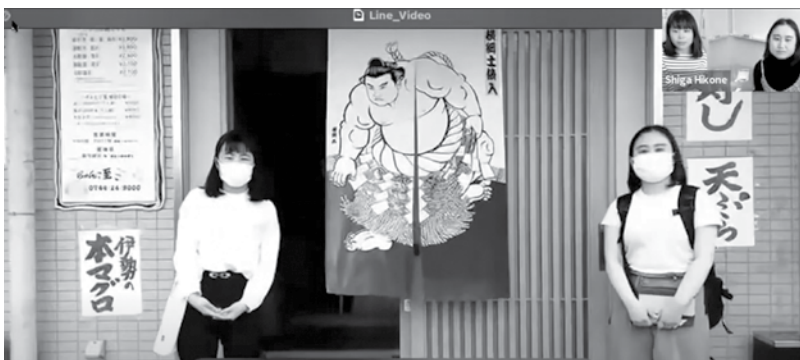
ちゃんこ鍋店での取材内容を紹介し、英語で質問に応じる二人。