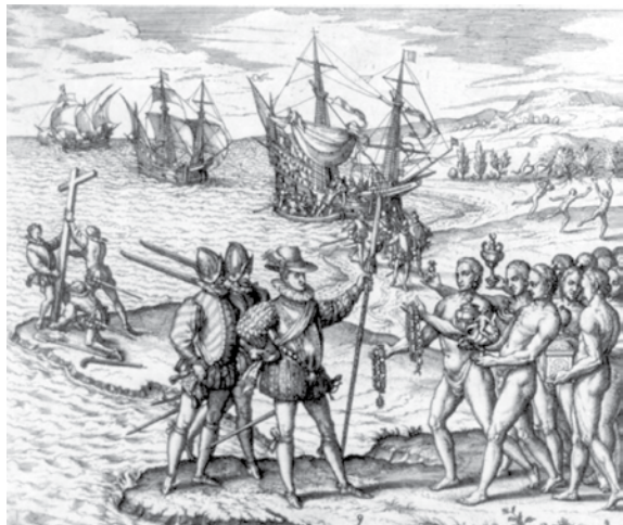
1492年12月6日、イスパニョーラ島に上陸するコロンブスを迎えるアラワク先住民。

寄宿制学校から生きて出てこられたとしても、トラウマを背負った若者は、アイデンティティも家族も失い、更なる苦悩に向き合うことになった。アルコールやドラッグに依存するようになった彼らが親になると、家庭が崩壊することが多かった。すると今度は、「子供が育つ環境ではない、悪影響だ」といい、政府機関が彼らの子供達をフォスターケア・システムに入れてしまう。フォスターファミリーは多くの場合ヨーロッパ系の非先住民で、その先住民の子供達はまたしても自分たちの文化を知らされずに育ち、多くの場合たらい回しにさ