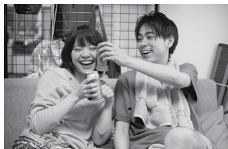
ヤクザと家族 The Family